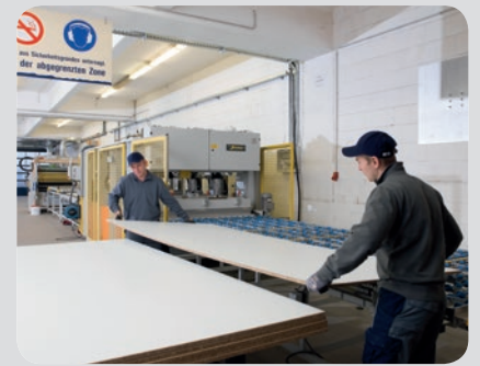
6. Verpressung der Schichtstoffe auf den Trägerplatten durch Druck und Hitze anschließend ist das Verbundelement fertig

Optional weitere Bearbeitung: Besäumung, Bekantung, Zuschnitt