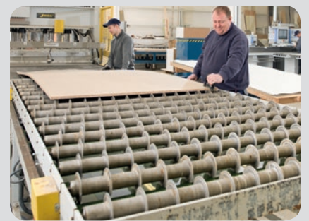
3. Gleichmäßiger Auftrag des D3-Dispersionsleim über die gesamte Walzenbreite anschließend reibungsloser Lauf der Platten auf Rollen- und Messerscheibenrollenbahnen