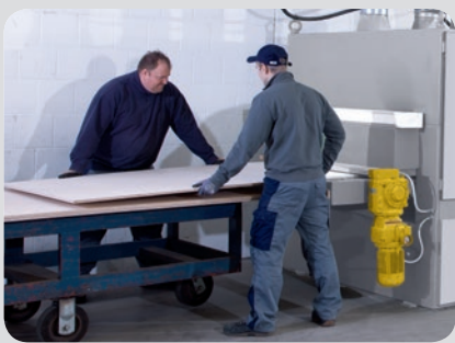
1. Kalibrierung der Platten