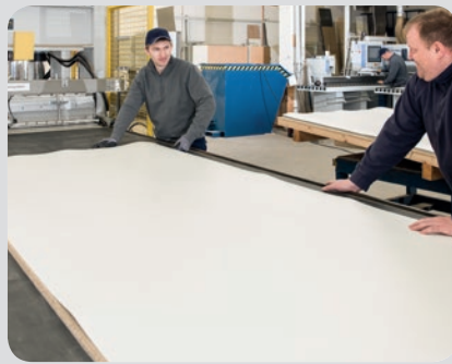
5. Ausrichtung des Schichtstoffes auf der Oberseite