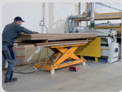
2. Beidseitiges Säubern der Platten durch die Bürstmaschine